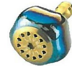
ファイヤー・ゴールド