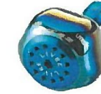
ファイヤー・ブルー