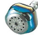
ファイヤー・チタン